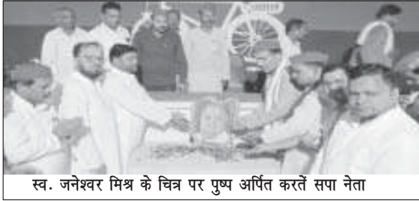
स्व. जनेश्वर मिश्र के चित्र पर पुष्प अर्पित करते सपा नेता