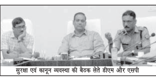
सुरक्षा एवं कानून व्यवस्था की बैठक लेते डीएम और एसपी

शाहजहांपुर (स्वतंत्र भारत)। जिलाधिकारी उमेश प्रताप सिंह एवं पुलिस अधीक्षक एस आनन्द की अध्यक्षता में आगामी आयोजित होने वाले पर्वों के दृष्टिगत सुरक्षा एवं कानून व्यवस्था के सम्बन्ध में महत्वपूर्ण बैठक कलेक्ट्रेट सभागार में हुई। बैठक के दौरान डीएम ने सभी सम्बन्धित अधिकारियों को निर्देशित किया कि आगामी त्योहारों के दृष्टिगत आवश्यक प्रबन्ध समय से पूर्ण किये जायें। उन्होंने सख्त निर्देश दिये कि जनता की सुरक्षा हेतु समस्त तैयारियां कर ली जायें। अग्निशमन व्यवस्था का समुचित प्रबन्ध किया जाये। उन्होंने बड़े आयोजन स्थलों पर सीसीटीवी कैमरों की व्यवस्था करने के निर्देश भी दिये। डीएम ने विद्युत विभाग के अधिकारियों को निर्देशित किया कि सम्बन्धित मार्ग में ढीले तारों को तत्काल ठीक करायें तथा आयोजन से पूर्व विद्युत सुरक्षा का प्रमाणपत्र अवश्य प्राप्त किया जाये। उन्होंने कहा कि आयोजन के आस पास स्थित समस्त ट्रांसफार्मर एवं पोल को ढकवाए जाने की कार्यवाही की जाए। उन्होंने सभी उपजिलाधिकारियों को निर्देशित करते हुए कहा कि अपने-अपने क्षेत्र