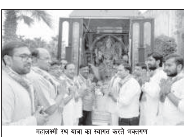
महालक्ष्मी रथ यात्रा का स्वागत करते भक्तगण