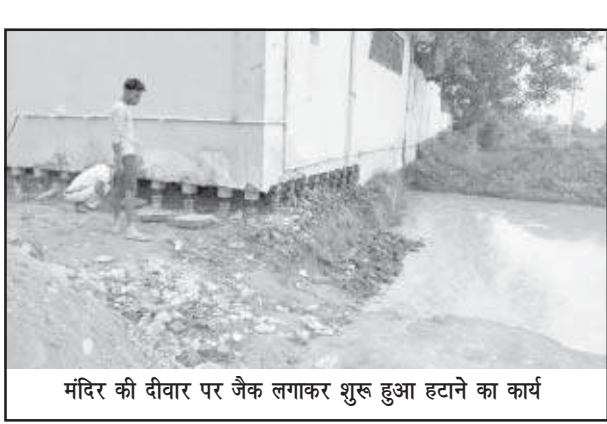
मंदिर की दीवार पर जैक लगाकर शुरू हुआ हटाने का कार्य

तिलहर-शाहजहांपुर (स्वतंत्र भारत)। लखनऊ से दिल्ली जाने वाले राष्ट्रीय राजमार्ग पर कछियानी खेड़ा प्रसिद्ध हनुमान मंदिर को पिछले दिनों प्रशासन द्वारा शिफ्ट कराने की प्रक्रिया शुरू हो गई। मंदिर की इमारतों पर जैक लगाकर नीचे से दीवार काटने का कार्य शुरू हो गया है। वहीं हनुमान मंदिर को ना हटाने के लिए हिंदू संगठन आए दिन मंदिर परिसर में पहुंच कर पूजा अर्चना करते हैं और सरकार एवं प्रशासन का विरोध कर रहे हैं। वहीं प्रशासन एवं पीएस की मौजूदगी में हरियाणा के