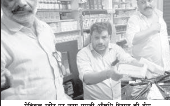
मेडिकल स्टोर पर छापा मारती औषधि विभाग की टीम

खुटार-शाहजहांपुर (स्वतंत्र भारत)। बुधवार की रात नगर के दो मेडिकल स्टोर पर मंडल स्तरीय औषधीय निरीक्षकों की टीम छापेमार मार दिया। जिससे मेडिकल स्टोर संचालकों में हड़कंप मच गया। घंटे तक चली छापामार कार्यवाही के बाद टीम कुछ दवाओं के सैंपल लेकर वापस लौट गई। छापामार कार्यवाही की खबर से मेडिकल स्टोर स्वामी अपनी अपनी दुकानें बंद करके भाग गए। बुधवार की रात नौ बजे के करीब औषधि विभाग और नारकोटिक्स विभाग की संयुक्त टीम ने नगर के मेन मार्केट स्थित मंसूरी मेडिकल स्टोर व बंडा रोड स्थित इंडिया मेडिकल स्टोर पर एक साथ छापा मार दिया। छापा मारने आई टीम ने मेडिकल स्टोरो पर पहुंचते ही सबसे पहले कर्मचारियों और मेडिकल स्वामी के मोबाइल फोन अपने कब्जे में ले लिए। इसके बाद दुकानों के शटर डाउन करके सभी को बाहर निकाल दिया और दुकान में दवाओं की जांच पड़ताल की। नगर में स्थित मेडिकल पर जब छापेमारी की