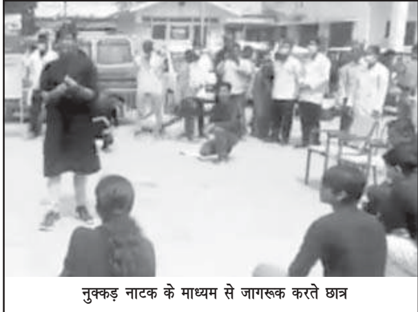
नुककड़ नाटक के माध्यम से जागरूक करते छात्र

दवाई रिक्शन होने पर टोल फ्री व एप पर दर्ज कराए शिकायत