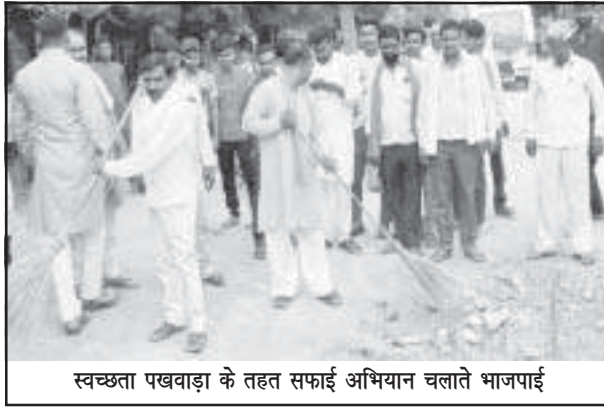
स्वच्छता पखवाड़ा के तहत सफाई अभियान चलाते भाजपाई