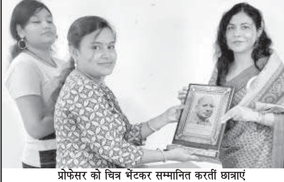
प्रोफेसर को चित्र भेंटकर सम्मानित करती छात्राएं