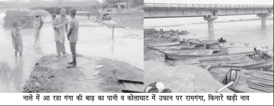
नालों में आ रहा गंगा की बाढ़ का पानी व कोलाघाट में उफान पर रामगंगा, किनारे खड़ी नाव

मिर्जापुर-शाहजहांपुर (स्वतंत्र भारत)। ब्रह्मपतिवार सुबह से ही गंगा-रामगंगा का जलस्तर स्थिर है। जिससे नदियों के तटवर्ती गांवों के बांशियों ने राहत की सांस ली है। हालांकि क्षेत्र में बहने वाली दोनों नदियां अभी भी उफान पर हैं। प्रशासन ने कोलाघाट में चलने वाली नावों के संचालन में पूरी तरह रोक लगा दी है। रामगंगा के जलस्तर में बुधवार से हुई अप्रत्याशित वृद्धि से रामगंगा के तटवर्ती ग्राम मौजपुर के जवाड से निकला बाढ़ का पानी ग्राम पहुंचा आते होते हुए हरिहरपुर की ओर आने लगा है। जिससे ग्रामीणों में बाढ़ का भय बढ़ गया था। हालांकि नदी का जलस्तर स्थिर हो जाने से अब लोगों में फिलहाल बाढ़ का खतरा टलता नजर आ रहा है। जिससे वे राहत महसूस कर रहे