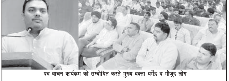
पत्र वाचन कार्यक्रम को सम्बोधित करते मुख्य वक्ता धर्मैद व मौजूद लोग

शाहजहांपुर (स्वतंत्र भारत)। राष्ट्रीय स्वयंसेवक संघ शाहजहांपुर महानगर द्वारा शोध पत्र वाचन प्रेक्षागृह में संचारी रोग अभियान के अंतर्गत नगर क्षेत्र में चलने वाले अभियान पर एक बैठक हुई। बैठक में नगर आयुक्त द्वारा नगर क्षेत्र की मोहल्ला निगरानी समितियों के अध्यक्षों से अपील की गई कि अपने-अपने क्षेत्र में सफाई व्यवस्था का विशेष ध्यान रखें एवं लोगों को सफाई के प्रति सहयोग करने की अपील की गई। नगर निगम के सफाई एवं खाद्य निरीक्षकों, सफाई नायकों, सहायक सफाई नायक को निर्देशित किया गया कि नगर क्षेत्र में संचारी रोग अभियान के अंतर्गत