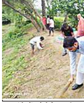
प्रधानमंत्री नरेंद्र मोदी के जन्म दिवस के अवसर पर आयोजित सेवा पखवाड़ा के तहत विकासखंड खैरबाद क्षेत्र के परसेहरा खुर्द ग्राम स्थित अमृत-सरोवर पर भारतीय

सितंबर को 3:30 बजे जिला अधिकारी कार्यालय पर उपस्थित होकर अपना मांग पत्र जिला अधिकारी के माध्यम से उच्च अधिकारियों को प्रेषित किया जाएगा जिसमें शिक्षक संघ के सभी पदाधिकारी एवं शिक्षक कार्यक्रम में सम्मिलित होंगे।